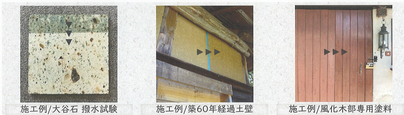
施工例/大谷石 撥水試験