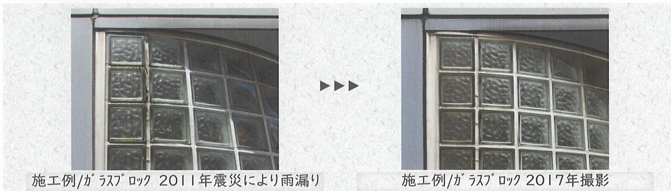
施工例/ガラスブロック 2011年震災により雨漏り